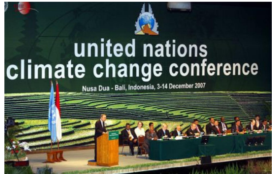
Tổng thư ký LHQ phát biểu tại COP13