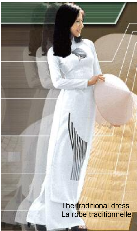
The traditional dress La robe traditionnelle

Welcome to Vietnam! Bienvenu au Vietnam!