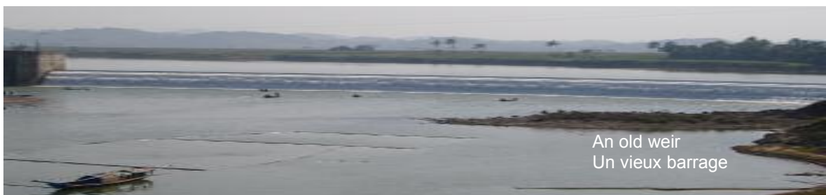
An old weir Un vieux barrage