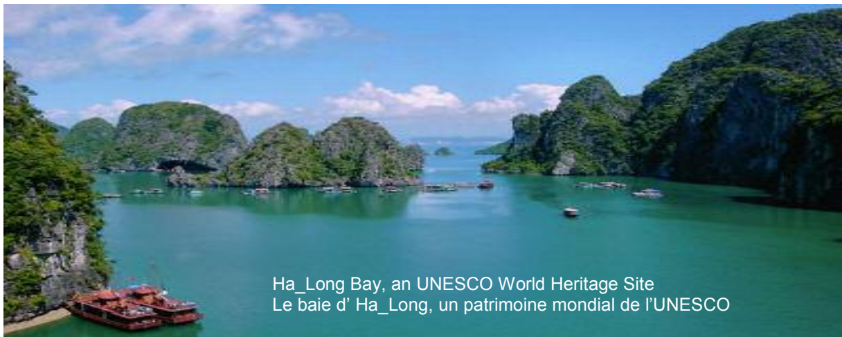
Ha_Long Bay, an UNESCO World Heritage Site Le baie d' Ha_Long, un patrimoine mondial de l'UNESCO