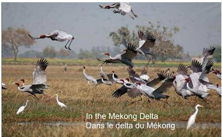
In the Mekong Delta Dans le delta du Mékong