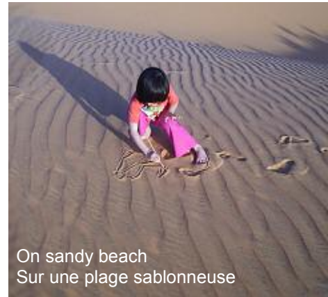
On sandy beach Sur une plage sablonneuse