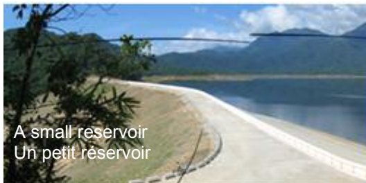
A small reservoir Un petit réservoir