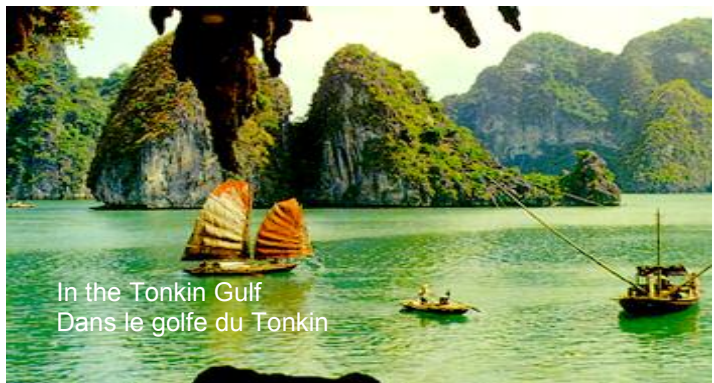
In the Tonkin Gulf Dans le golfe du Tonkin