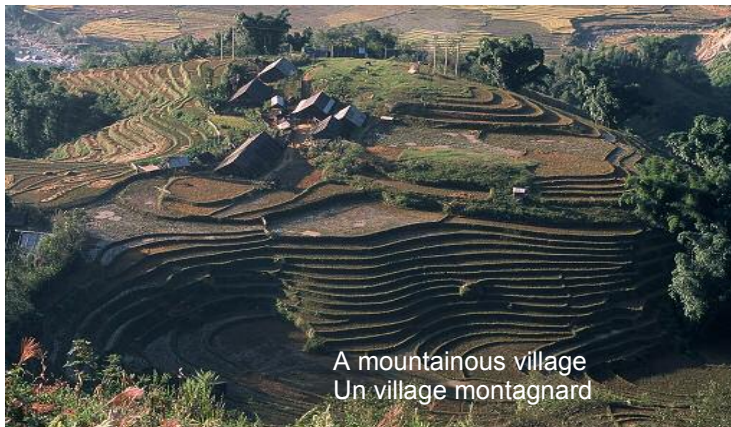
A mountainous village Un village montagnard

Le Vietnam est un pays d'Asie du Sud Est. Il occupe une superficie de 331.690 km 2 avec environ 85 millions d'habitants. Les coordonnées terrestres sont approximativement 102° à 109° longitude Est & 8° à 23° latitude Nord. Il a la forme d'un S étiré, dont les extrémités seraient distantes de 1650 km avec une frontière maritime de 3260 km. Les zones de montagne et de hauts-plateaux occupent les deux tiers du territoire. Le climat vietnamien est de type tropical et subtropical. Il diffère considérablement selon les régions en raison des différences de latitude et du relief varié. Il existe deux saisons : la saison sèche (de novembre à avril en général, de février à août dans le Centre) et une saison pluvieuse (le reste du temps). Les changements de température en été & en hiver sont plus marqués au Nord, où la différence atteint jusqu'à 30°C alors qu'elle n'est que de 7°C au Sud. Le Nord possède donc quatre saisons. Le Vietnam est maintenant connu l'un des pays les plus amicaux en Asie avec des paysages splendides & une riche culture et il est prêt à vous accueillir pour un voyage merveilleux & inoubliable. Rejoignez-nous et explorez un beau pays en marche du développement & d'intégration globale!