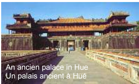
An ancien palace in Hue Un palais ancien à Hué