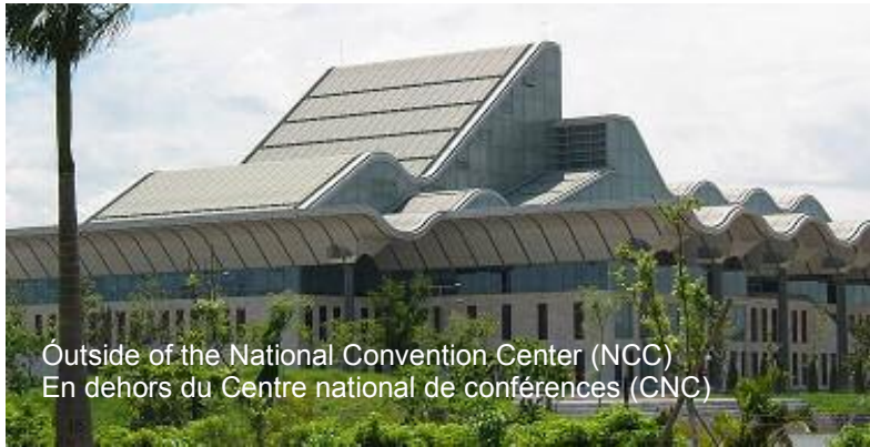
Outside of the National Convention Center (NCC) En dehors du Centre national de conférences (CNC)