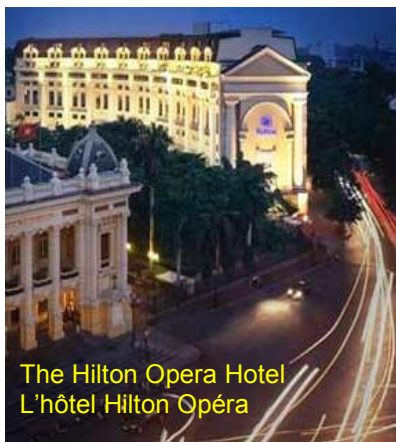
The Hilton Opera Hotel L'hôtel Hilton Opéra