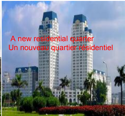
A new residential quarter Un nouveau quartier résidentiel