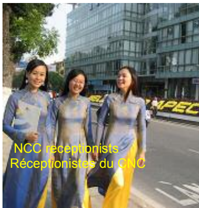
NCC receptionists Réceptionnistes du CNC