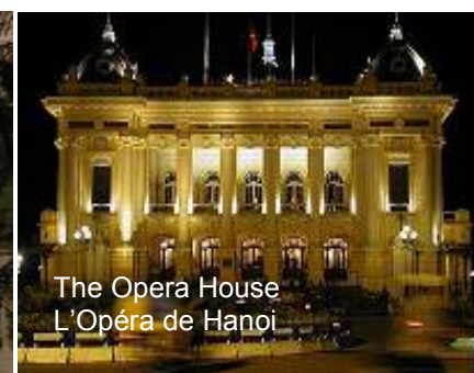
The Opera House L'Opéra de Hanoi