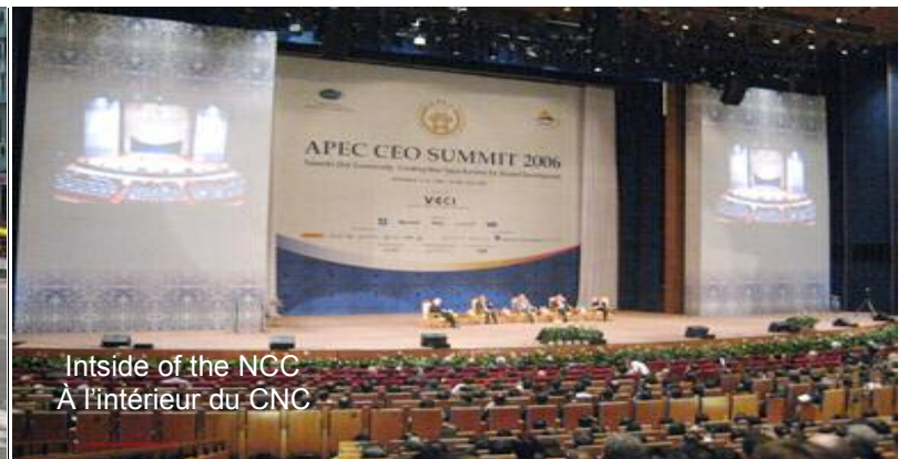
Inside of the NCC À l'intérieur du CNC