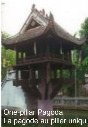
One-pillar Pagoda La pagode au pilier unique