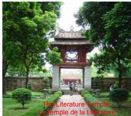
The Literature Temple Le temple de la Littérature