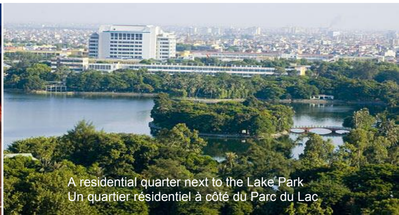
A residential quarter next to the Lake Park Un quartier résidentiel à côté du Parc du Lac