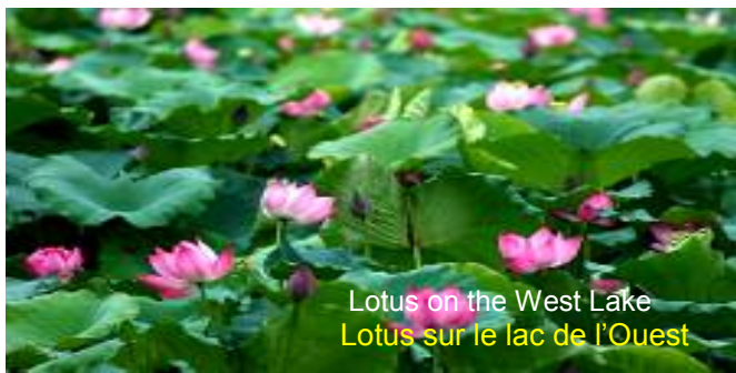
Lotus on the West Lake Lotus sur le lac de l'Ouest