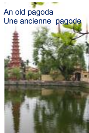
An old pagoda Une ancienne pagode