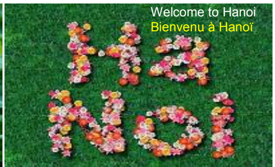
Welcome to Hanoi Bienvenu à Hanoi