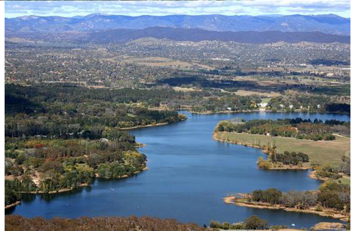
H.2c: Hồ Burley Griffin của Thủ đô Canberra nước Úc

Kinh nghiệm thế giới cho thấy hồ là không gian công cộng cho phép con người sống trong đô thị chật hẹp đầy cao ốc bị “thiếu chân trời” có dịp mở rộng tầm nhìn ra xa, và cũng là không gian hòa hoãn cho các loại “xung đột” trong đô thị, đồng thời là nơi có môi trường sinh thái trong lành. Hồ và công viên quanh nó còn giúp bảo vệ đa dạng sinh học trong đô thị. Khi hồ có nhiều di sản lịch sử và văn hóa vật thể và phi vật thể thì càng giúp làm giàu thêm bản sắc đô thị, làm sâu sắc cảm nhận nơi chốn cho du khách và bồi dưỡng niềm tự hào cũng như cảm nhận quy thuộc của người dân sở tại. Cuối cùng, hồ không chỉ góp phần nâng cao chất lượng sống đô thị mà còn đóng góp vào sự phồn vinh của đô thị nếu biết khai thác