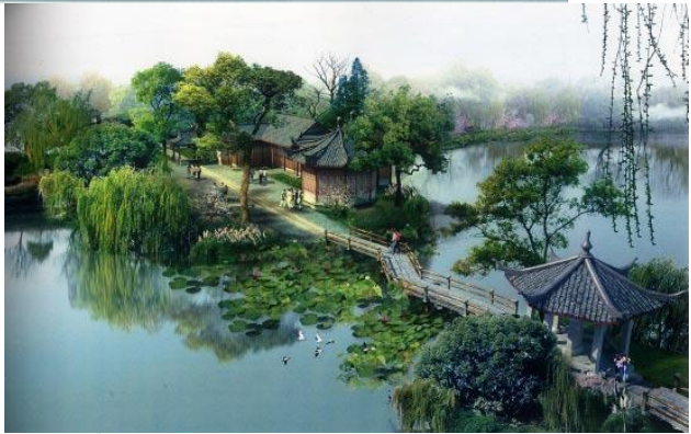
H.2b: Tây Hồ thành phố Hàng Châu