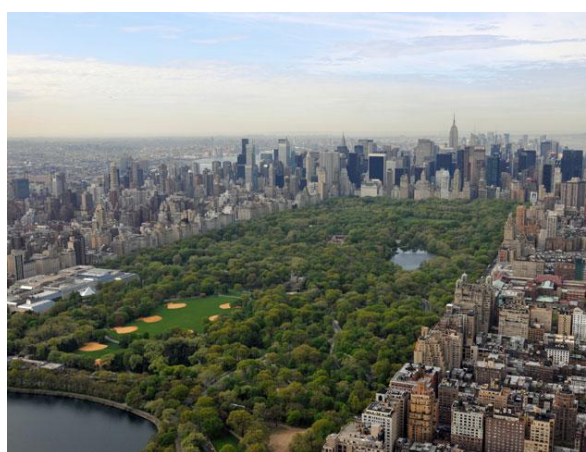
H.2a: Công viên trung tâm Manhattan