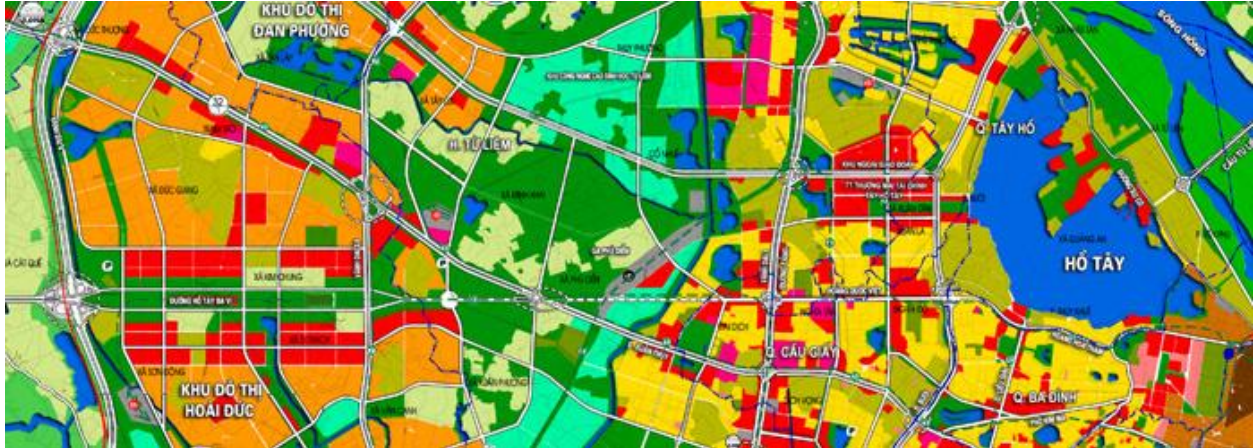
H.1 Tuyến trục Hồ Tây - Ba Vì

Vì, một không gian đặc sắc của Hà Nội mở rộng (H.1). Vậy Thành phố Hà Nội nên làm gì để chuyển đổi Hồ Tây rộng hơn 500 ha từ một tài nguyên quý hiếm thành tài sản có giá trị tạo vốn phát triển trong kỷ nguyên mới của mình?