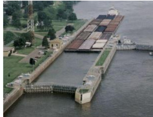
Âu tàu trên sông Mississippi (Hoa Kỳ)