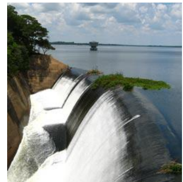
Nước tràn đập ở miền bắc Zimbabwe