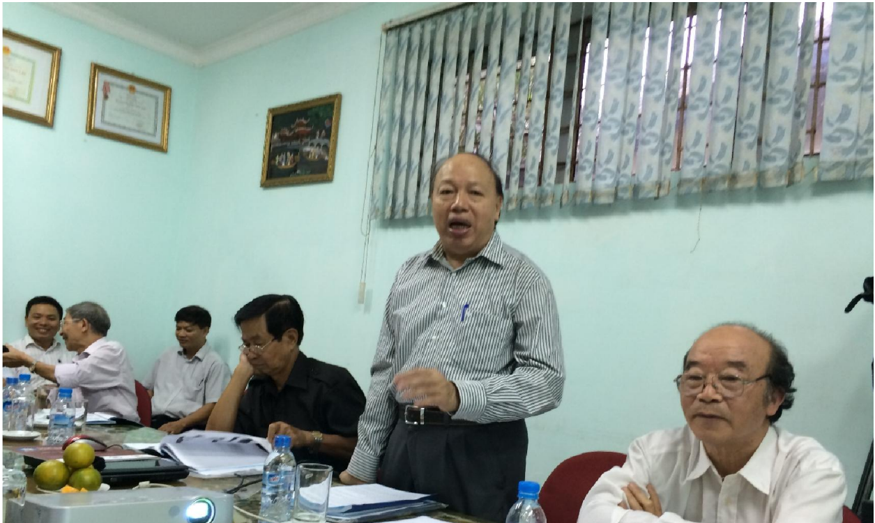
Các đại biểu tham gia thảo luận