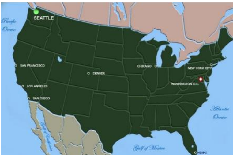
Vị trí Seattle trên bản đồ nước Mỹ

Thành phố cảng Seattle, thủ phủ bang Washington, ở cực tây bắc Hoa Kỳ, bên bờ Thái Bình Dương. Dân số 1,2 triệu người, song chỉ có 50% trong nội thành. Seattle là nơi đặt 'đại bản doanh' của hãng máy bay Boeing và hãng phần mềm Microsoft. Phong cảnh rất đẹp, khí hậu dễ chịu, thoáng mát, hải sản nước lạnh rất dồi dào nên hấp dẫn đông khách du lịch.