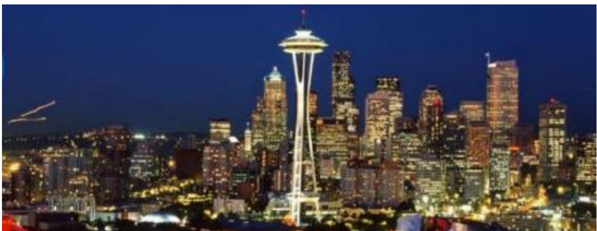
Seattle rực rỡ sau lúc hoàng hôn