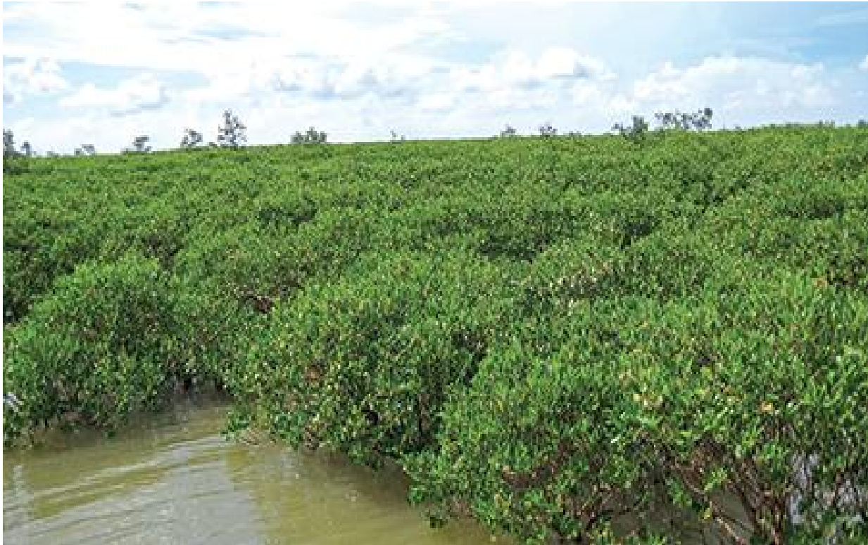
Rừng ngập mặn ở Thái Thụy

Bản báo cáo đánh giá tác động môi trường (ĐTM) lần thứ nhất của tỉnh Thái Bình đã được Hội đồng thẩm định chỉ ra khá nhiều vấn đề cần bổ sung, làm rõ, trong đó có câu hỏi: Tại sao phải lấy tới 320 ha, trong đó có 150 ha rừng ngập mặn, có thể tìm phương án khác giảm lấy rừng ngập mặn không? Khi lấy rừng ngập mặn, sẽ ảnh hưởng đến môi trường, hệ sinh thái như thế nào? Vấn đề ô nhiễm môi trường do công nghiệp, dịch vụ sẽ ra sao?