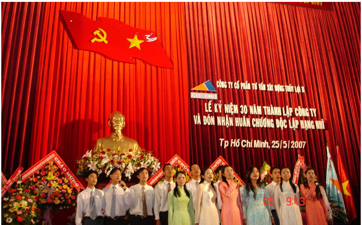
Tốp ca của lớp trẻ HEC2