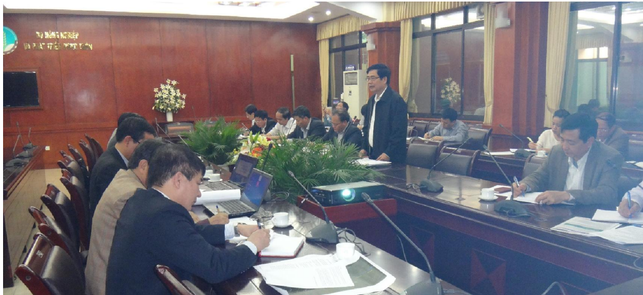
Bộ trưởng Cao Đức Phát khai mạc và kết luận tại buổi họp