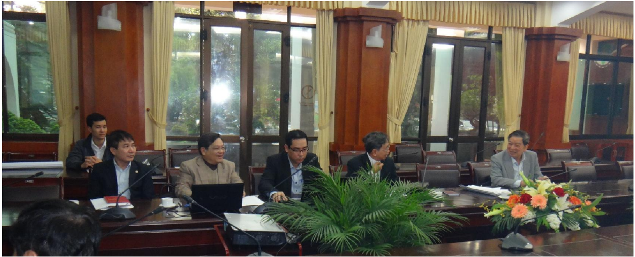
Các đại biểu VNCOLD