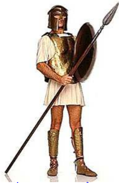
Chiến binh Hy Lạp cổ đại