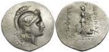
Đồng tiền cổ Hy Lạp được tìm thấy tại khu vực khai quật