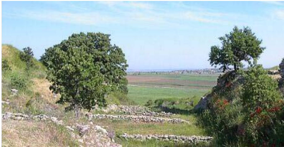
Gò đất ở Hisarlik, phía xa là eo biển Dardanelles