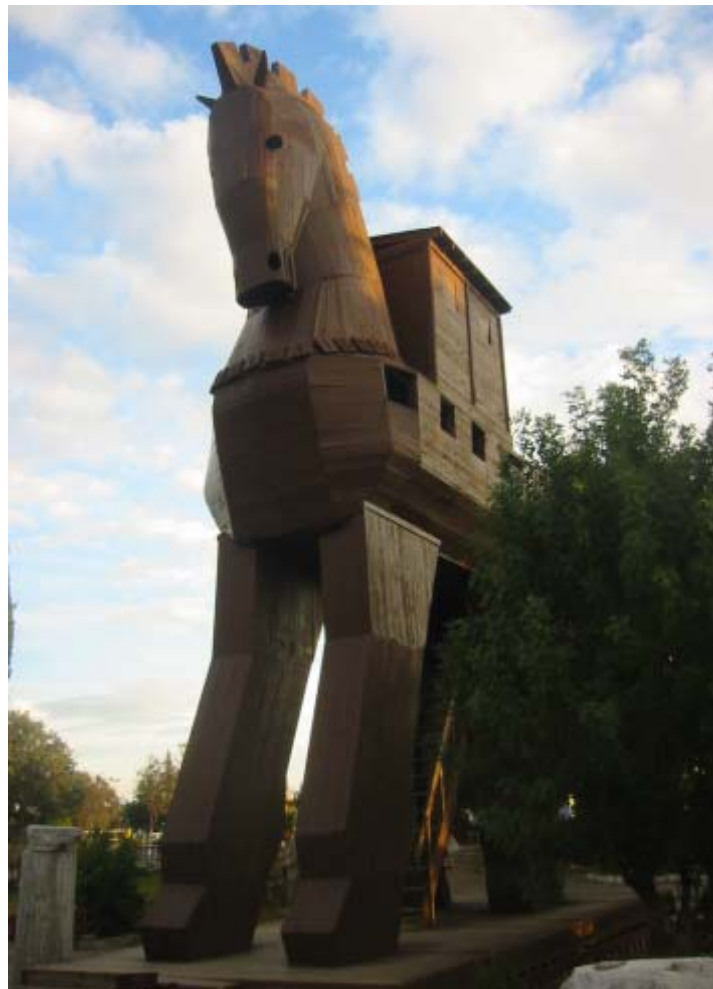
Dựng lại ngựa gỗ làm điểm thu hút khách du lịch