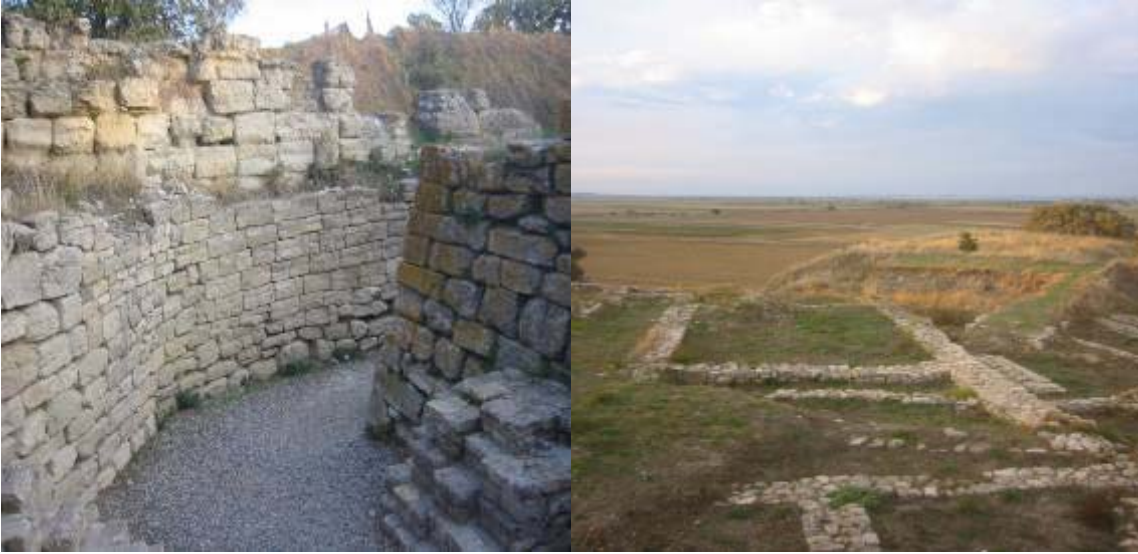
Một số di tích được phát hiện khi khai quật