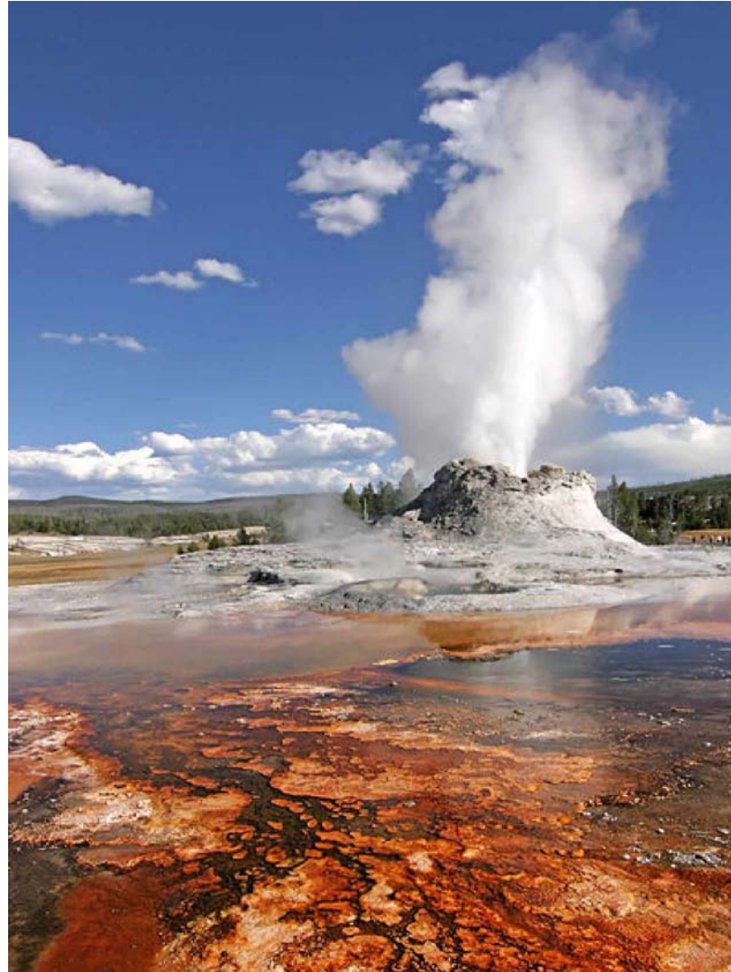
Cột nước nóng Castle, cứ 91 phút lại 1 lần phụt cao

Việc bảo tồn các loại thú đó đã gây nhiều tranh cãi. Chẳng hạn, năm 1914, để bảo vệ đàn hươu, người ta ra lệnh loại bỏ các đàn sói. Các tay thợ săn được khuyến khích diệt sói. Ít lâu sau, sói hầu như bị tuyệt chủng. Năm 1990, lại thấy phải phục hồi đàn sói và công việc này được xúc tiến khẩn trương. Sự việc cũng xảy ra tương tự như thế với các loại thú khác. Vừa mới đây, các tổ chức Care2 và "Defenders of Wildlife (Bảo vệ Đời sống hoang dã)" đã lên tiếng tố cáo giới chức trong bộ máy của Nhà Trắng, đứng