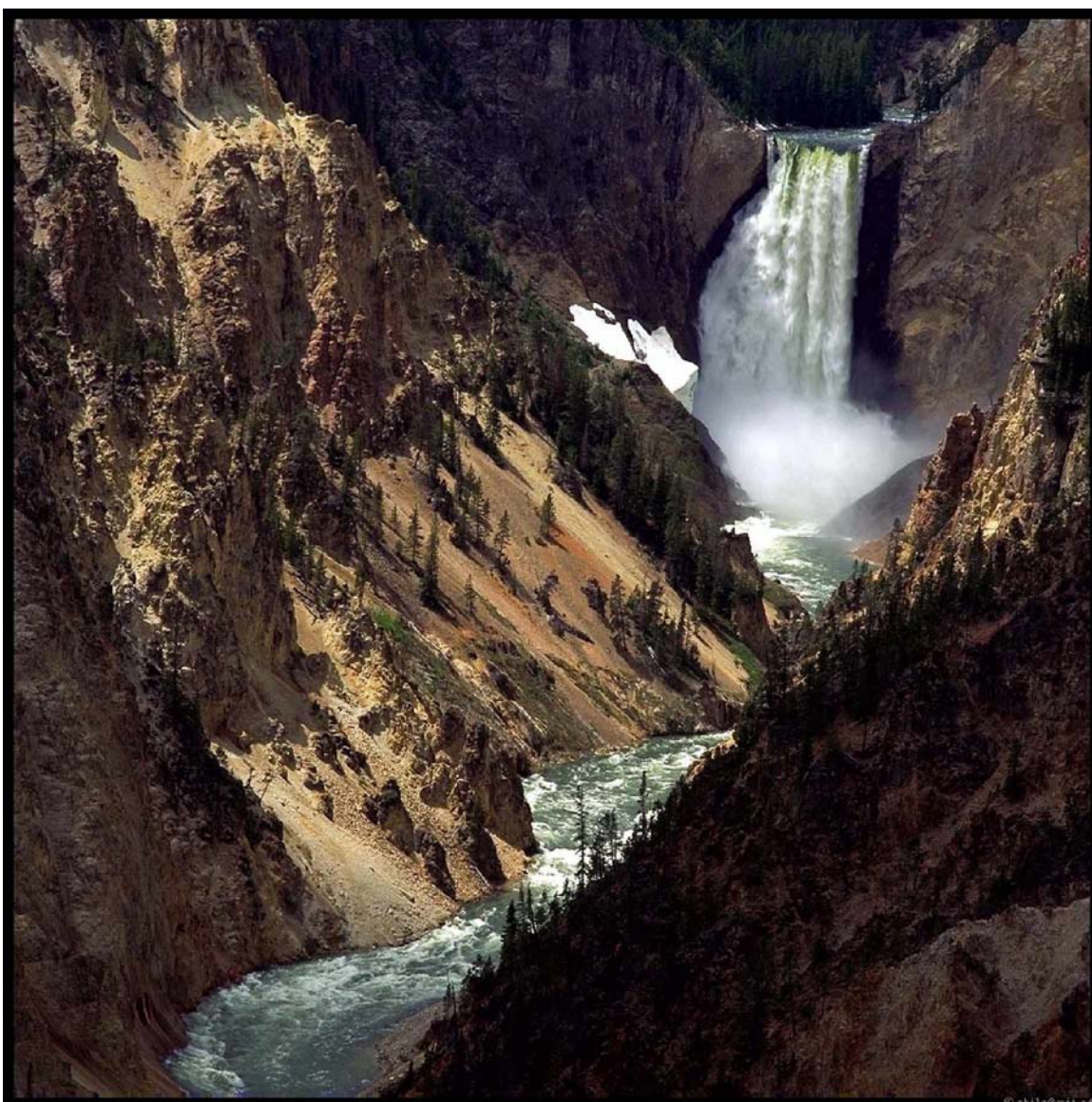
Trong vườn Yellowstone có 290 thác nước có độ cao chênh nhau từ 4,5m đến 94m. Một trong số đó là thác qua hẻm Grand Canyon (ảnh trên).

Các cơ sở nghỉ dưỡng và tham quan thường xuyên thu hút rất đông khách. Năm 2006 đã có gần 3 triệu lượt khách du lịch đến Vườn.