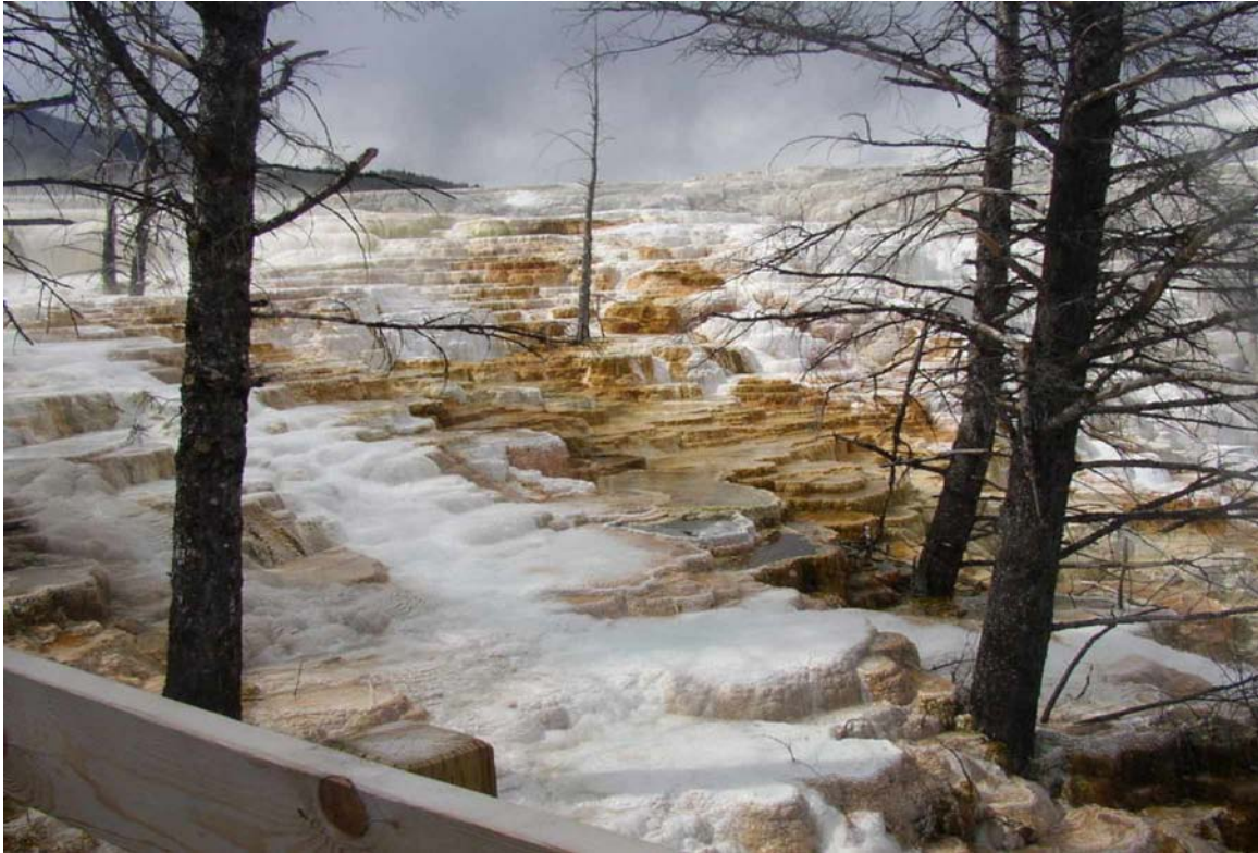
Suối nước nóng Mammoth