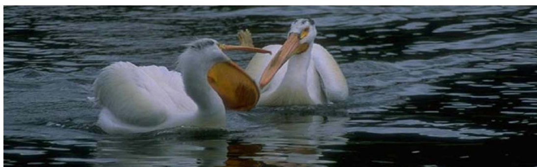
Vịt có túi ở mỏ