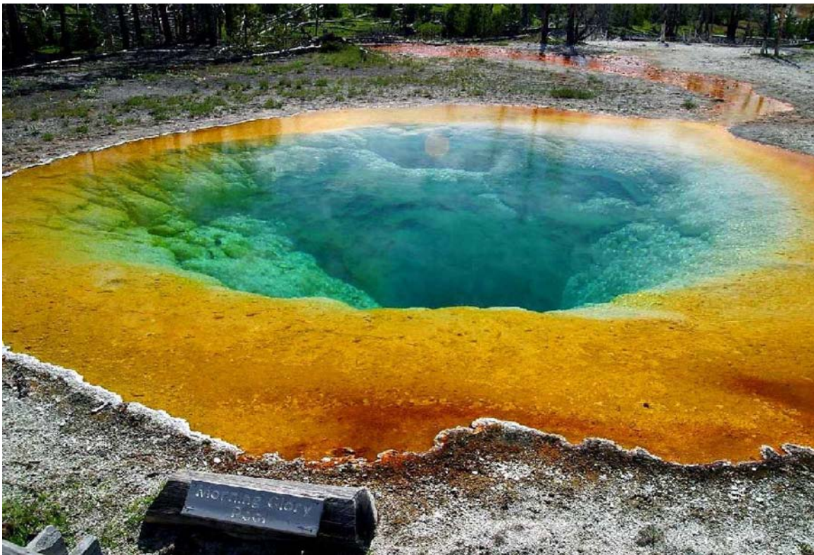
Giếng nước nóng Morning Glory