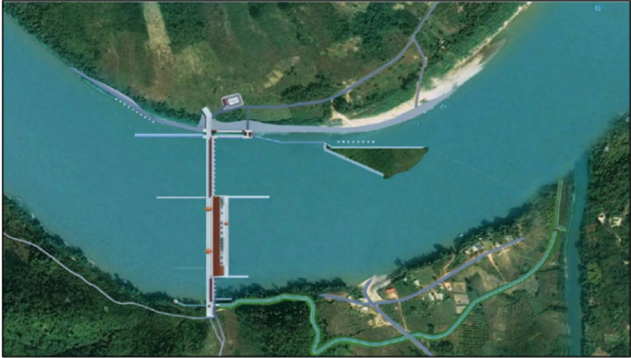
Bình đồ mô hình thủy điện Sanakham

Quá trình tham vấn trước là một phần của các quy tắc tổ tụng của MRC về sử dụng nước của dòng chính sông Mekong: Thủ tục thông báo, tham vấn trước và thỏa thuận (PNPCA). Theo PNPCA, bất kỳ dự án cơ sở hạ tầng nào sử dụng nước chính trong mùa khô trong cùng một lưu vực, cũng như trong mùa mưa giữa hai lưu vực, đều phải trải qua quá trình tham vấn trước. Các dự án áp dụng bao gồm phát triển thủy lợi và thủy điện quy mô lớn có thể gây ra tác động đáng kể đến môi trường, dòng nước và chất lượng của dòng chính sông Mekong.