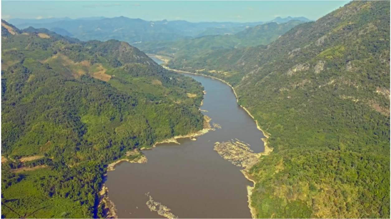
Nơi dự định xây dựng thủy điện Sanakham trên sông Mekong

Viêng Chăn, CHDCND Lào, ngày 11 tháng 5 năm 2020 - CHDCND Lào sẽ thực hiện quy trình tham vấn trước của Ủy ban sông Mekong (MRC) cho dự án thủy điện Sanakham, dự án đề xuất thứ sáu về dòng chính sông Mekong. Thủy điện sẽ hoạt động liên tục quanh năm với công suất 684 MW.